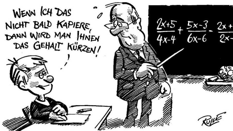
Die Schule der Zukunft?